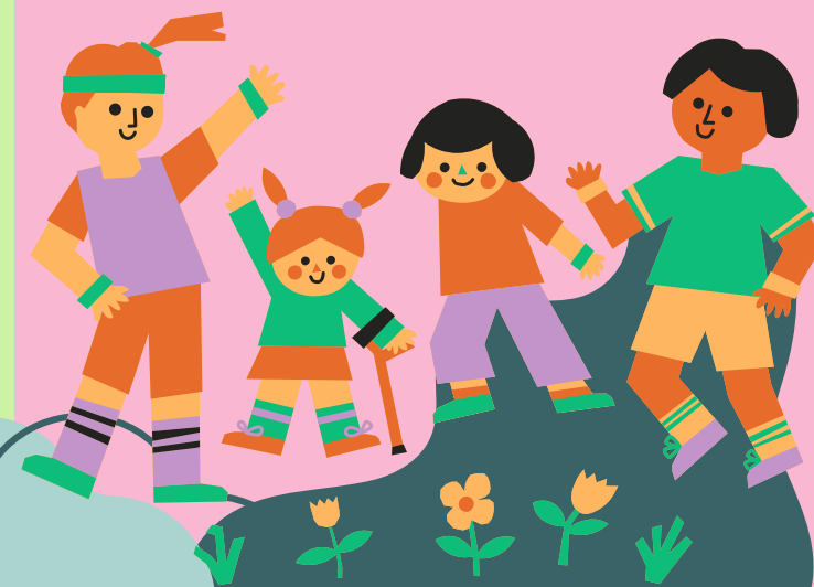
График работы: с 09:00–21:00, ежедневно.